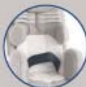
Cinturón pélvico 45°