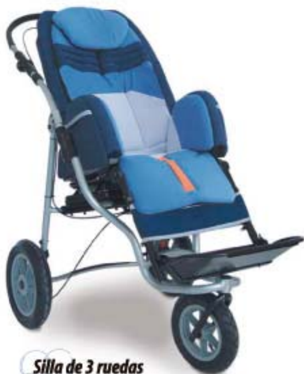
Silla de 3 ruedas