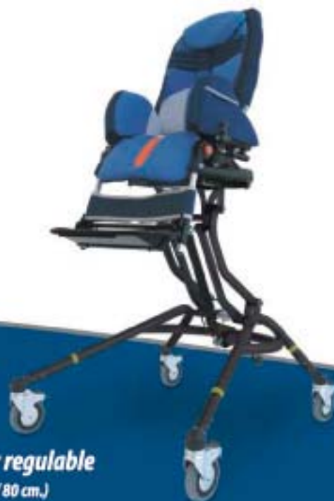
Base interior regulable en altura (40/80 cm.)