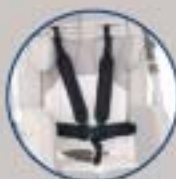
Chaleco 5 puntos