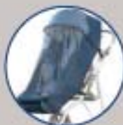
Funda livia (colocación con capota)