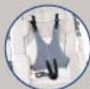
Arnés 5 puntos