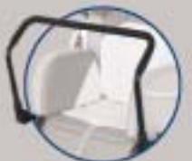
Barras frontal de apoyo