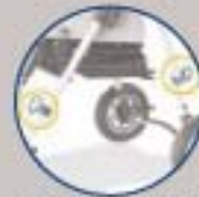
Ganchos de fijación silla