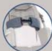
Soporte traxco flexible con correas